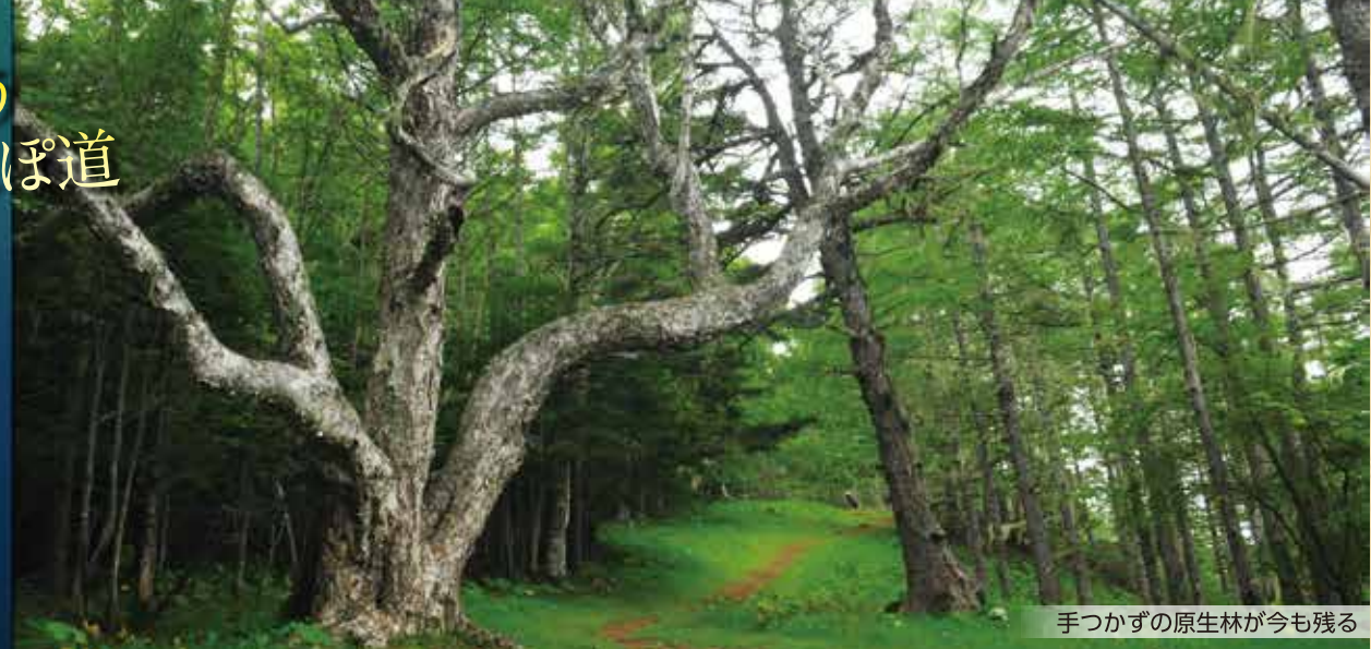
手つかずの原生林が今も残る