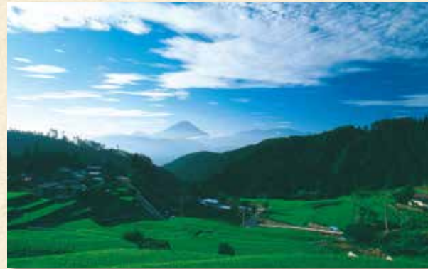
棚田(平林地区)の向こうに望む富士山

富士川町はあちこちから富士山の眺望を楽しむことができる。春のサクラ、夏の新緑と…秋冬とはまた違った富士山の表情が浮かび上がる。ぜひあなた好みのビュースポットを見つけてみてはどうだろうか。