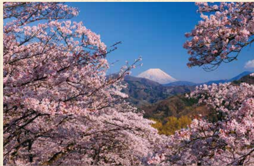
大法師公園の桜と富士山